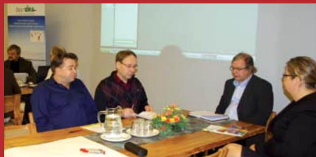
Uusi SeutUra -hanke järjesti "Joustava työelämä – parempi elämä" -askeleita työpajan, jossa etsittiin Pielisen Karjalan Tulevaisuusfoorumin teemasta konkreettisia toimenpide-ehdotuksia.